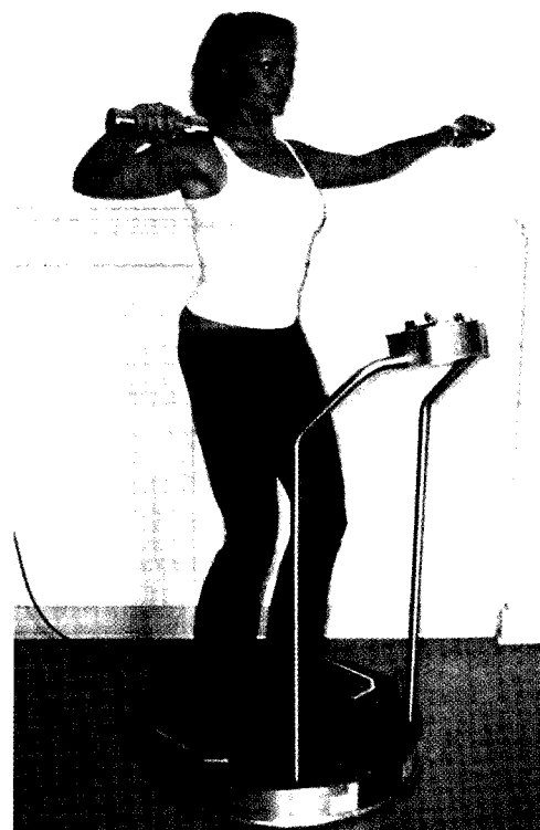
Abb. 4: Im Fortgeschrittenentraining können Übungen aus dem Freihanteltraining integriert werden, um die Muskulatur des gesamten Körpers noch umfassender einzubeziehen

Beim Training mittels Vibrationsplattformen kommt der Körperhaltung eine besondere Bedeutung zu. Es hat sich bisher gezeigt, dass Haltungskonzepte von krankengymnastischen Behandlungsverfahren, die über die Kopf- und Wirbelsäulenaufrichtung auch die Gliedmaßen beeinflussen, besonders geeignet sind, Vibrations-