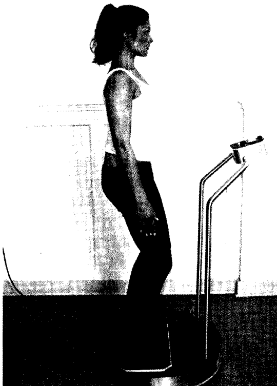
Abb. 1: Die Grundhaltung als Ausgangsposition für das Training: hüftbreiter bipedaler Stand mit parallel gestellten Füßen – Hüfte, Knie und Sprunggelenke ca. 10° beugen, wobei das Knie exakt über den Fuß vorgeführt wird – gleichmäßige Lastverteilung über dem Vor- und Rückfuß – Arme locker seitlich herabhängen lassen – Kopf in einer Linie mit der entlordosierten und aufgerichteten Halswirbelsäule gerade und aufrecht halten – Schultern nach hinten unten in Richtung Becken schieben – Brustbein vorschieben – Becken aufrichten und zum Bauchnabel ziehen

nung von Muskelkettenreaktionen und einer aufgerichteten Kopf- und Rumpfhaltung aus und berücksichtigen letztlich ebenso wie Alexander mit seiner Alexander-Technik, dass über die primär steuernde Funktion des Kopfes der Muskeltonus und damit die Haltung und Haltungskontrolle positiv zu beeinflussen sind. Dabei spielt die Koaktivierung der Strecker- und Beugerschlinge eine entscheidende Rolle.